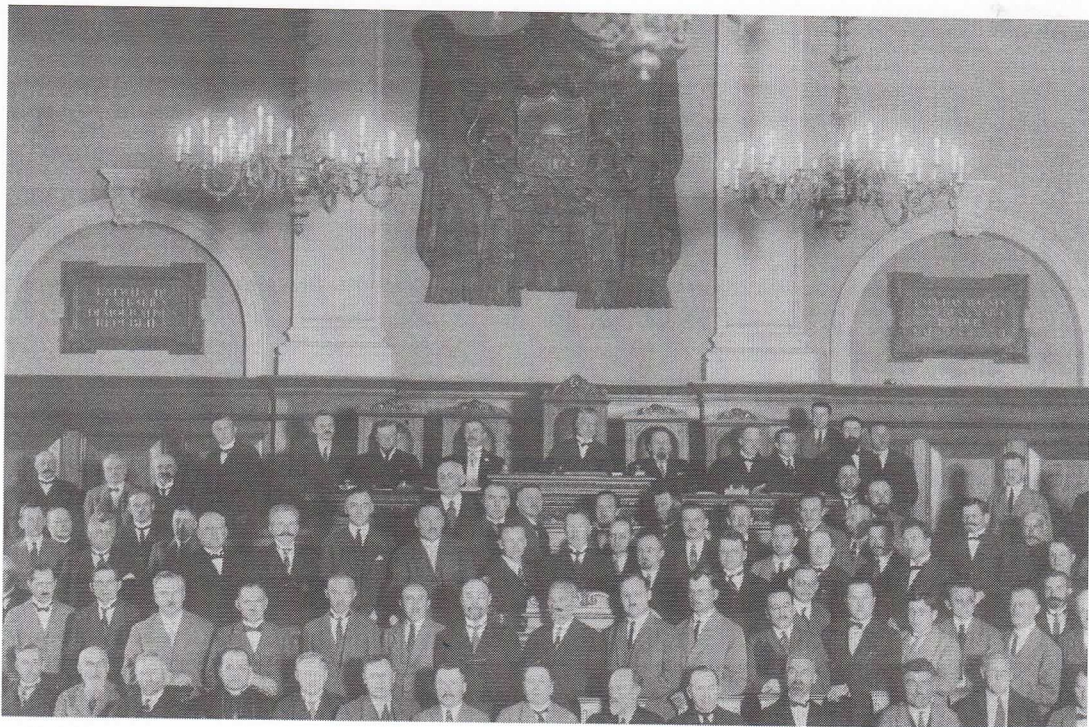
Latvijas Republikas 1. Saeimas pirmā sēde 1922. gada 7. novembrī