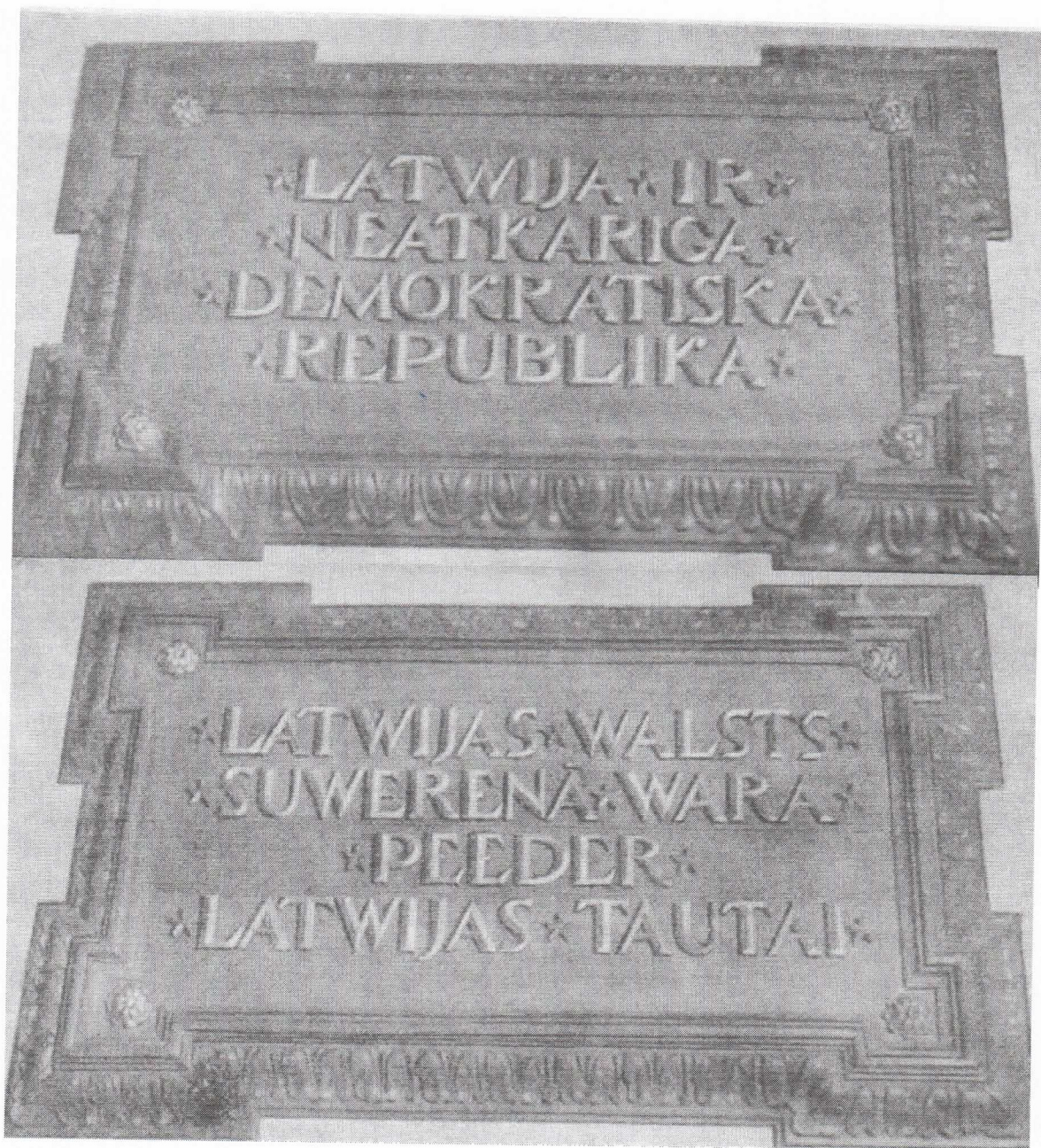
Satversmes 1. un 2.pantu plāksnes aiz Saeimas Prezidija sēdekļa Latvijas pirmsokupācijas periodā